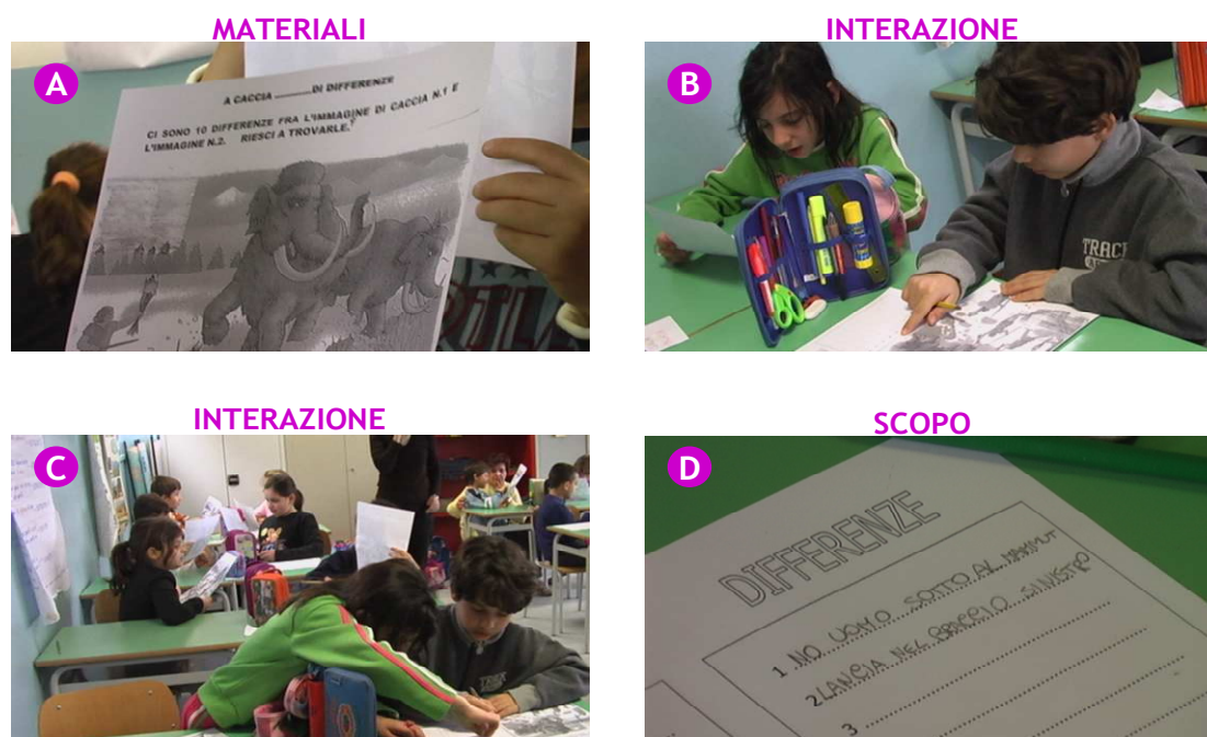
Figura 2 – Ricerca delle uguaglianze e delle differenze

La soluzione descritta di seguito esemplifica quest'ipotesi di lavoro. L'attività propone un lavoro a coppie con lo scopo di cogliere le uguaglianze e le differenze presenti in due immagini (Figura 2). Il lavoro sollecita simultaneamente cinque intelligenze: linguistica, logico-matematica, spaziale, naturalistica, interpersonale.